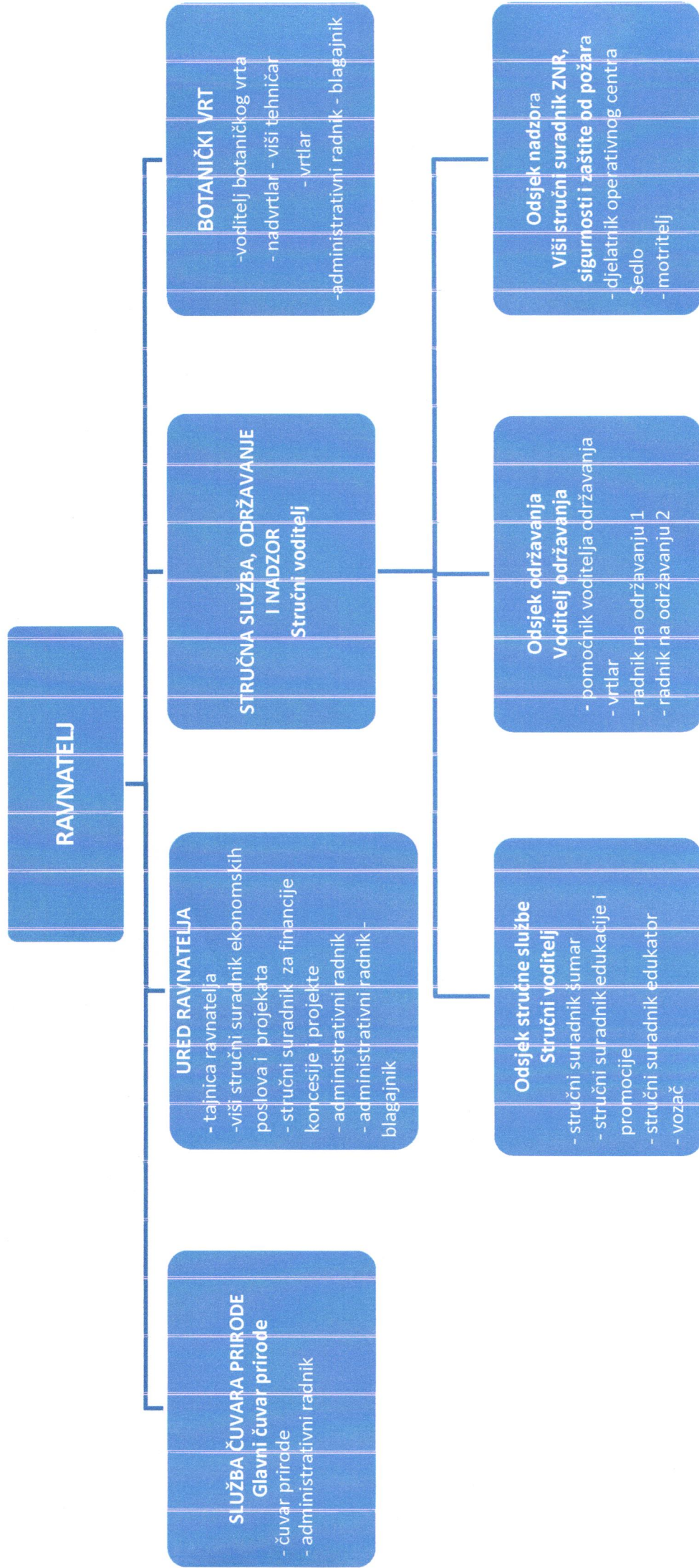
Prilog 2. – Pravilnik o unutarnjem ustrojstvu javne ustanove za upravljanje Park-šumom Marjan i ostalim zaštićenim prirodnim vrijednostima na području Grada Splita Shematski prikaz radnih mjesta po ustrojstvenim jedinicama